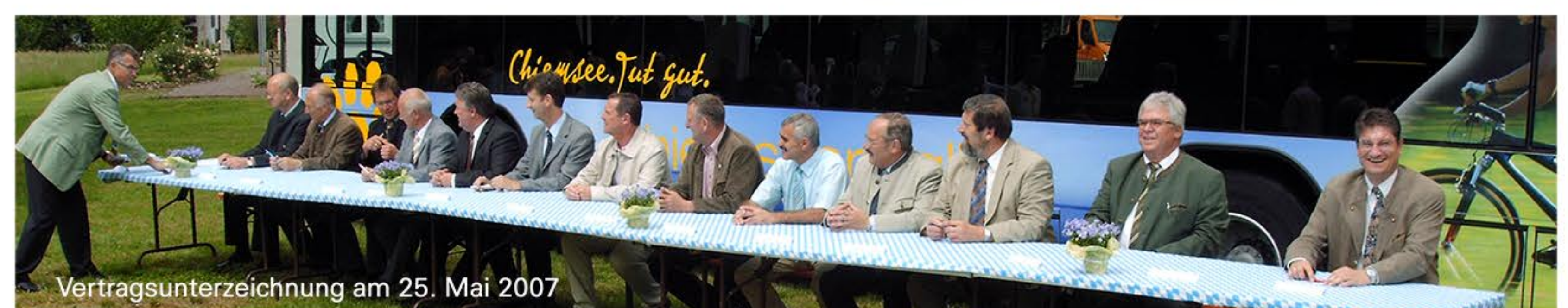
Vertragsunterzeichnung am 25. Mai 2007

Kontakt zum Abwasser- und Umweltverband: info@azv-chiemsee.de