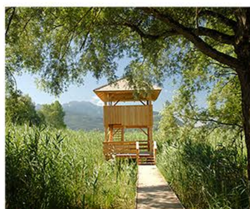
IW Irschener Winkel mit Turm