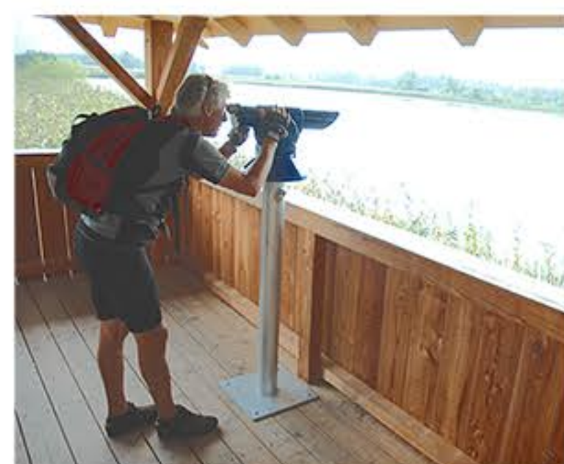
Einblick in das Vogelleben