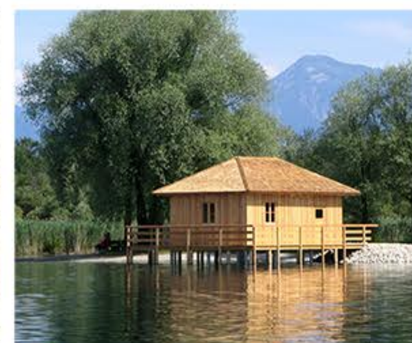
PM Hütte an der Prienmündung