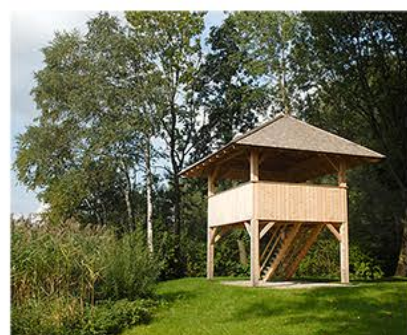
SB Seebruck mit Turm