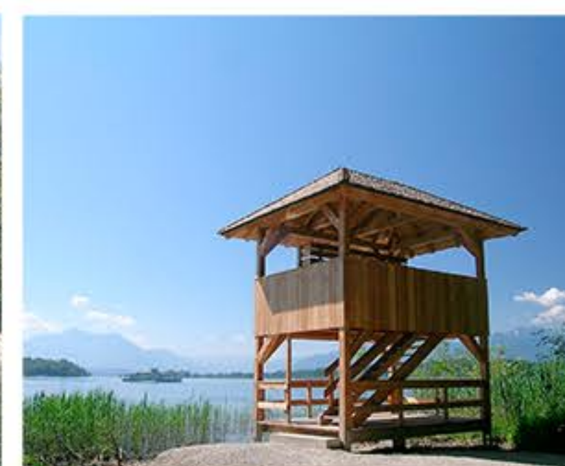
GZ Ganszipfel mit Turm