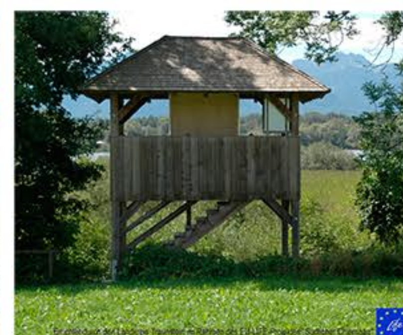
HA Aussichtsturm Hagenau