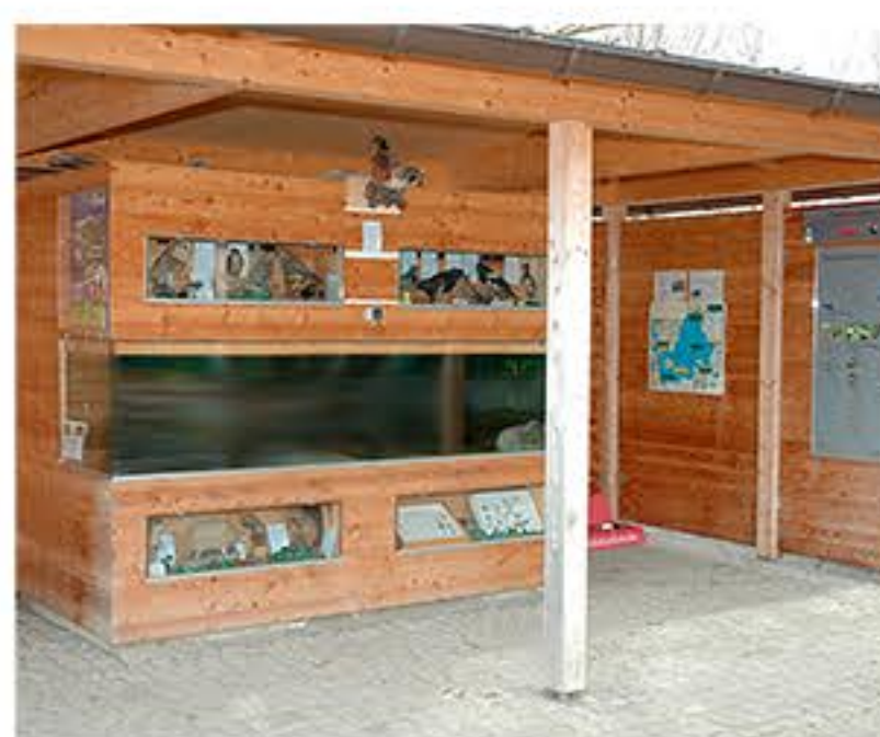
FB Aquarium Feldwieser Bucht