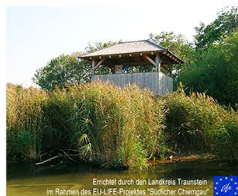
LG Lachsgang mit Turm