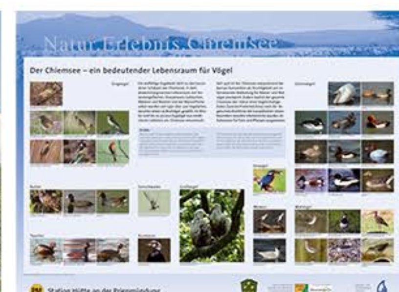
"Vögel am Chiemsee", eine der Tafeln zur Natur- und Heimatkunde rund um den See