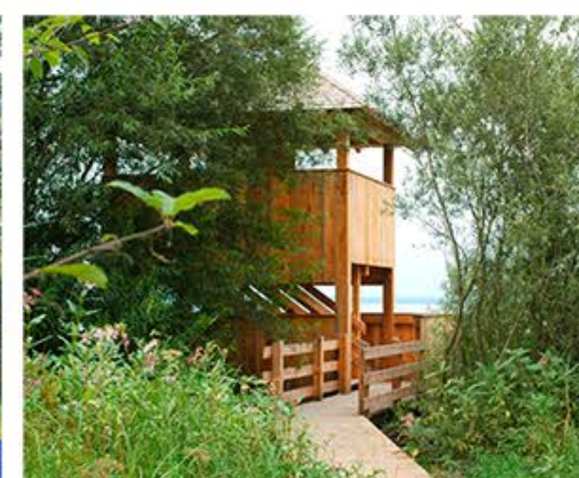
HB Hirschauer Bucht mit Turm