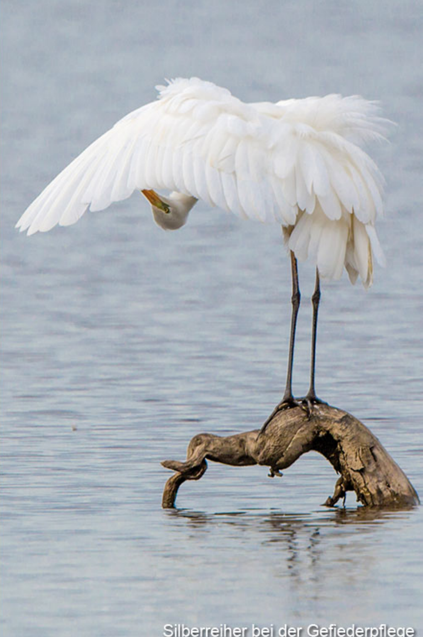
Silberreiher bei der Gefiederpflege

Ganzjährig geführte Vogelbeobachtungen am Chiemsee