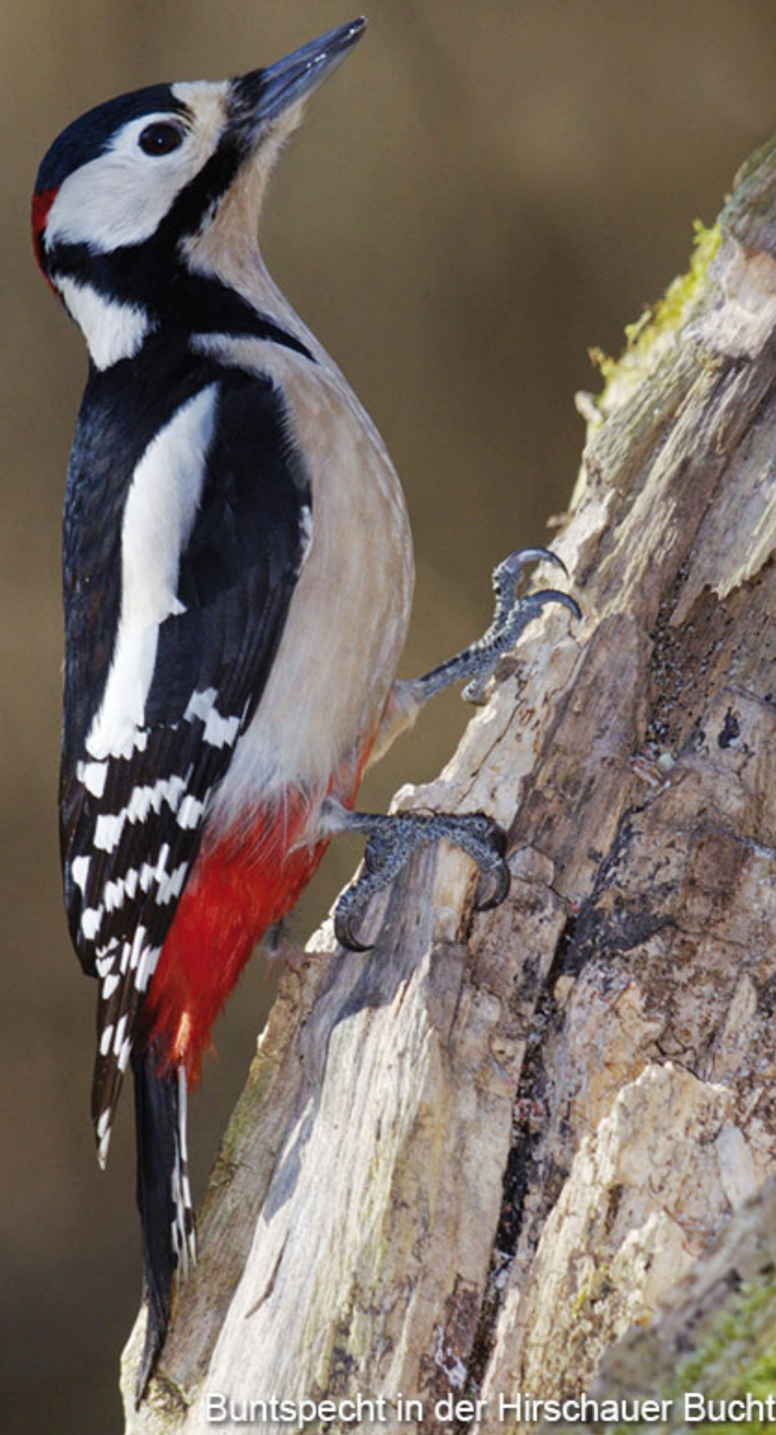
Buntspecht in der Hirschauer Bucht

Ganzjährig geführte Vogelbeobachtungen am Chiemsee