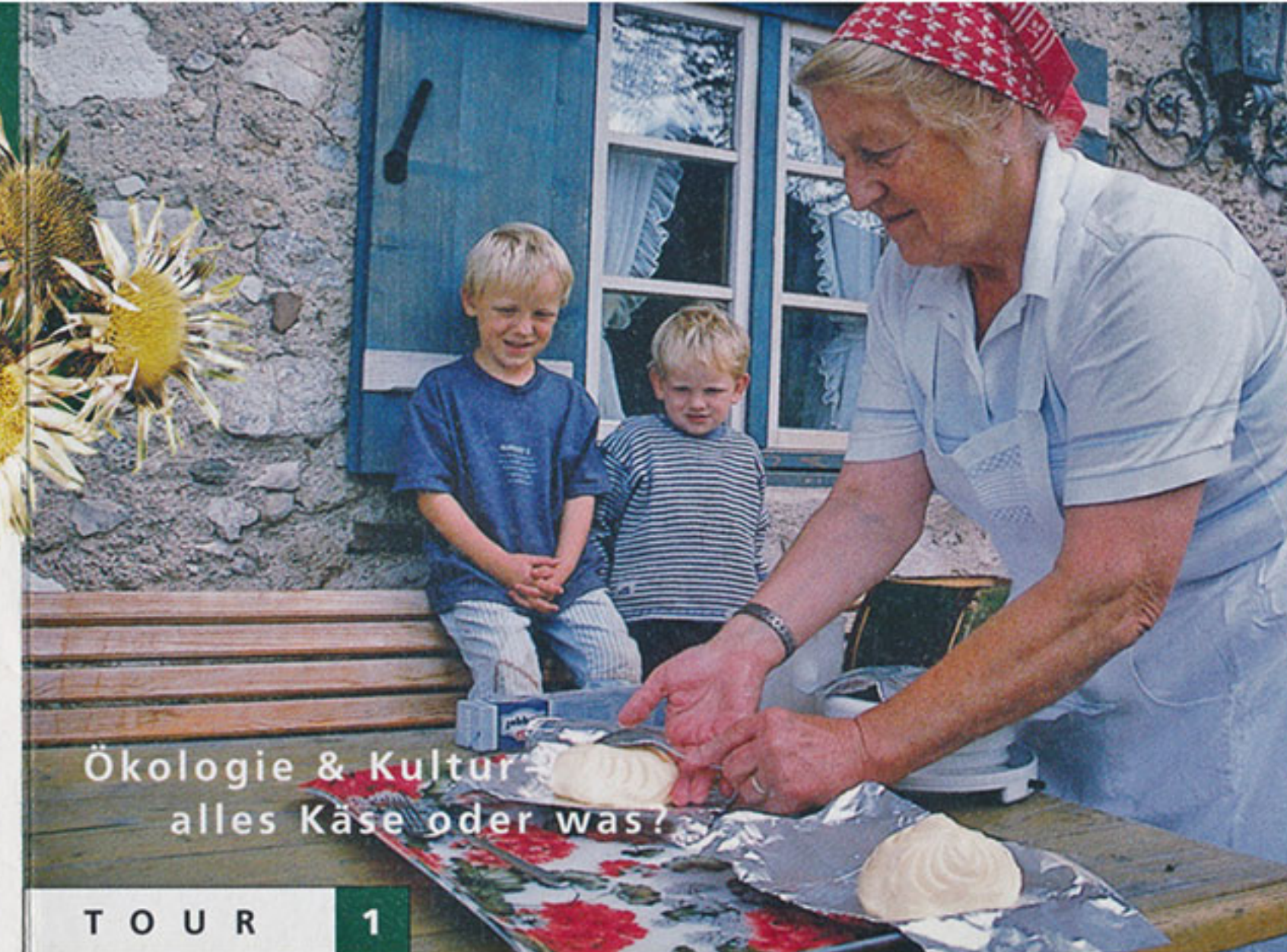
Ökologie & Kultur alles Käse oder was?