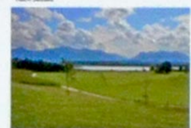
Wald am Kapellenberg an der Prienmündung