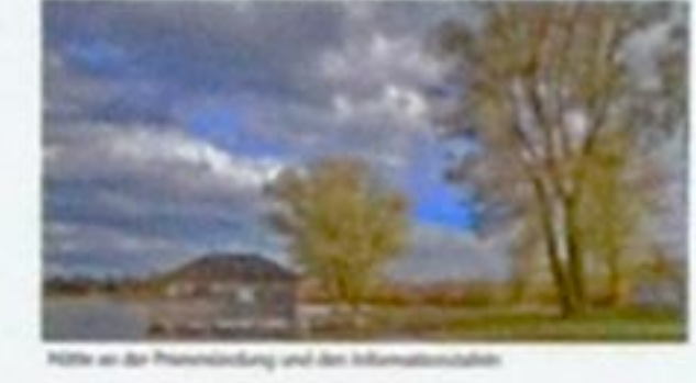
Hütte an der Prienmündung und der Informationsstation