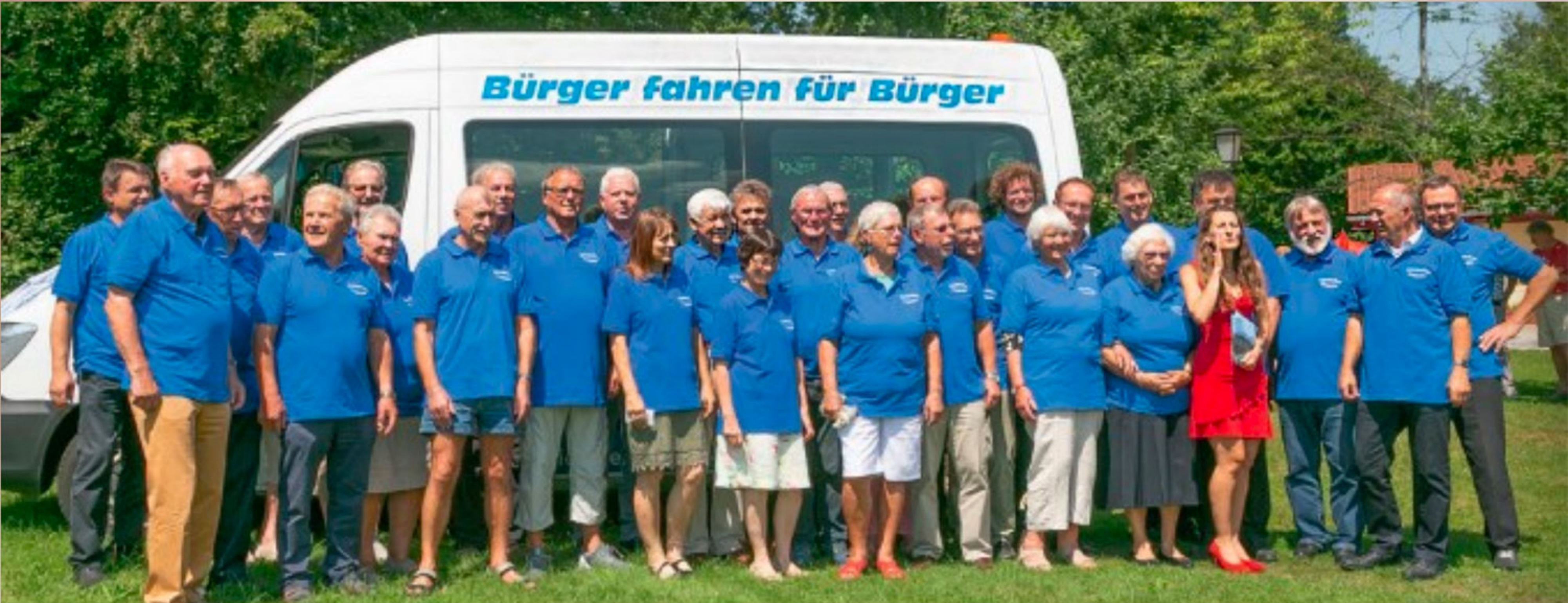
Ausgerüstet mit neuen T-Shirts wurden die Fahrerinnen und Fahrer des Bürgerbusses.