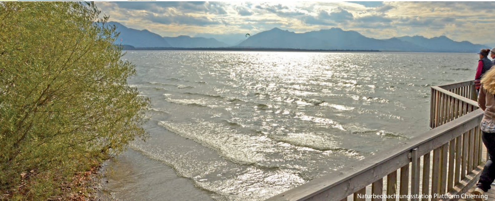
Naturbeobachtungsstation Plattform Chieming