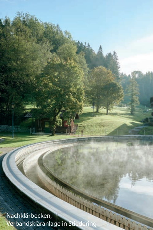
Nachklärbecken, Verbandskläranlage in Stiederling