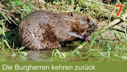
7 Die Burgherren kehren zurück