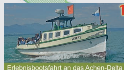
1 Erlebnisbootsfahrt an das Achen-Delta