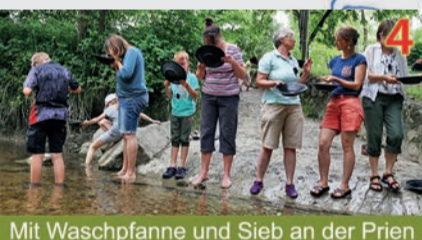
4 Mit Waschpfanne und Sieb an der Prien