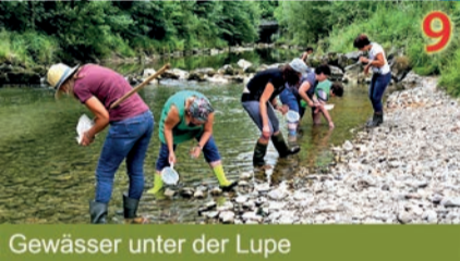
9 Gewässer unter der Lupe