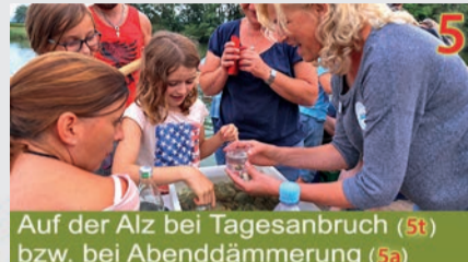
5 Auf der Alz bei Tagesanbruch (5t) bzw. bei Abenddämmerung (5a)