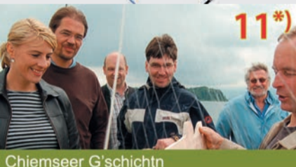
11 Chiemseer G'schichtn