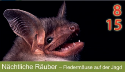
8 15 Nächtliche Räuber – Fledermäuse auf der Jagd