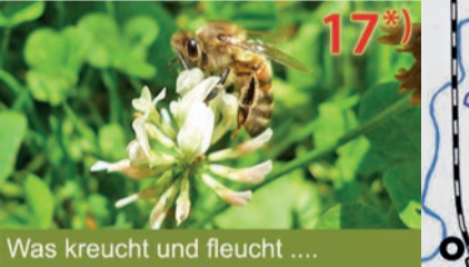
17 Was krecht und flecht ...