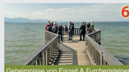
6 Geheimnisse von Eiszeit & Furchensteinen