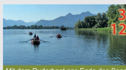
3 12 Mit dem Ruderboot ans Ende des Sees