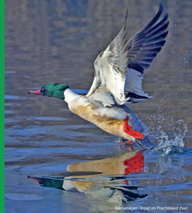
Gänsesäger - Erpel im Prachtkleid (hw)