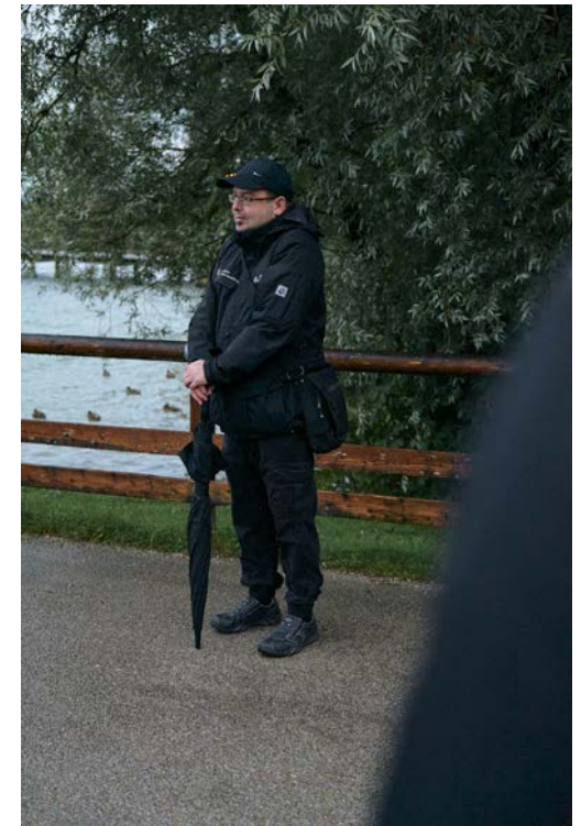
Auf Herrenchiemsee ist man jederzeit willkommen, auch zur „Fledermaus-Zeit“