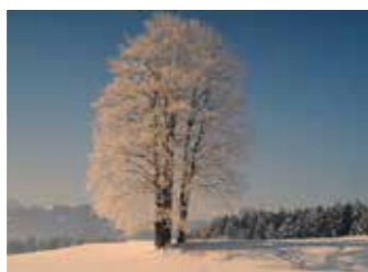
Rothbuche im Winter