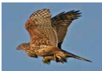
Habicht mit Hermelin