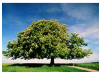
Kastanie im Frühling