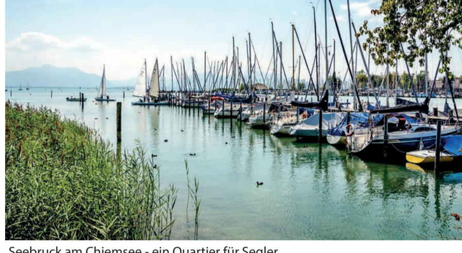
Seebruck am Chiemsee - ein Quartier für Segler

Einzelne Abschnitte am Chiemsee Rund- und Chiemsee Radweg sind als Erholungspromenaden vornehmlich für Fußgänger ausgewiesen.