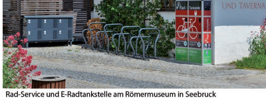
Rad-Service und E-Radtankstelle am Römermuseum in Seebruck

Der Chiemsee Radweg steht allen Radfahrern, auch sportlichen Radlern und e-Bikern zur Verfügung und weist wunderbare Panoramaabschnitte auf. Länge: 59 km