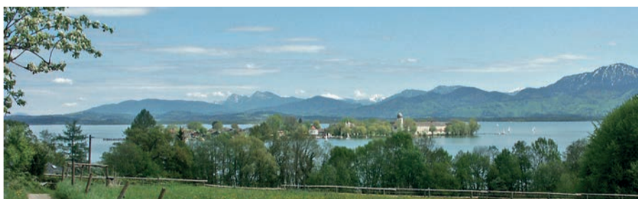
Fraueninselblick vom Höhenweg bei Aisching