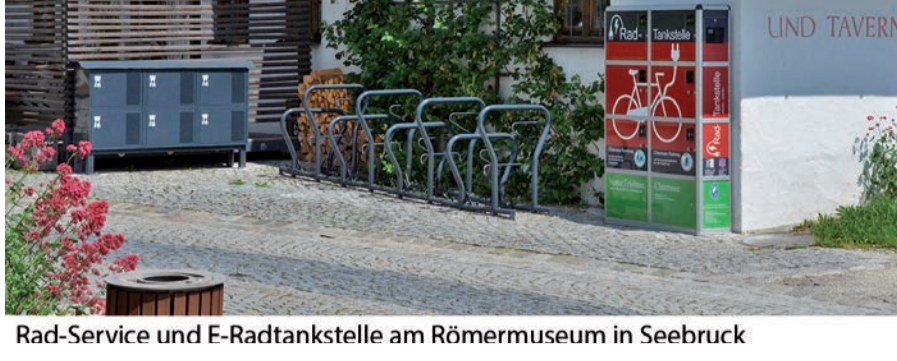
Rad-Service und E-Radtankstelle am Römermuseum in Seebuck

Der Chiemsee Radweg steht allen Radfahrern, auch sportlichen Radlern und e-Bikern zur Verfügung und weist wunderbare Panoramaabschnitte auf. Länge: 59 km