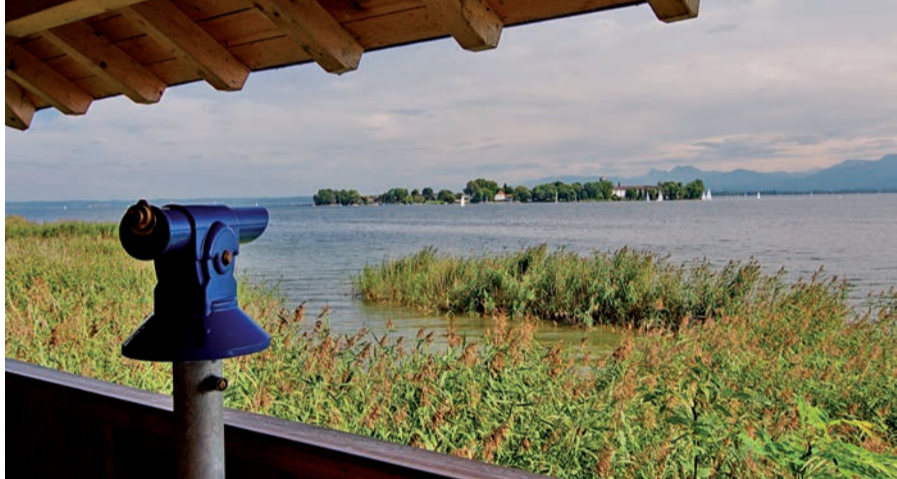
Aussicht vom Naturbeobachtungsturm Ganszipfel mit Blick auf die Fraueninsel