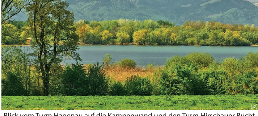
(jz) Blick vom Turm Hagenau auf die Kampenwand und den Turm Hirschauer Bucht