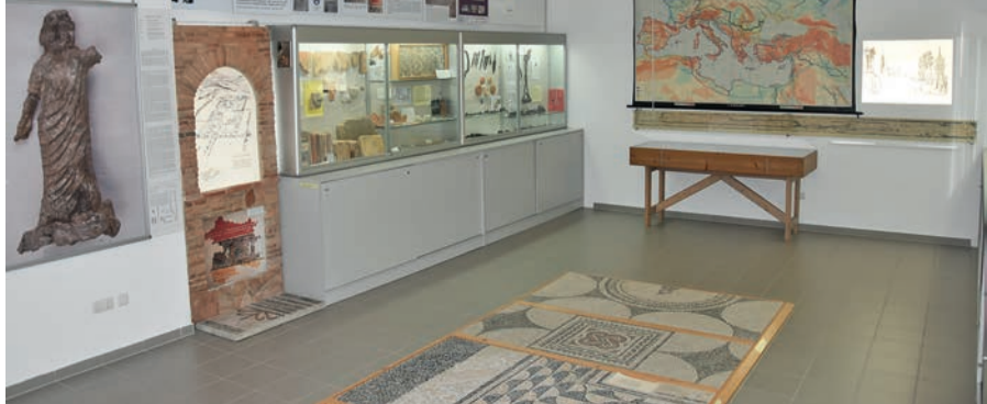
(jz) Römermuseum in der Schloßökonomie Grabenstätt