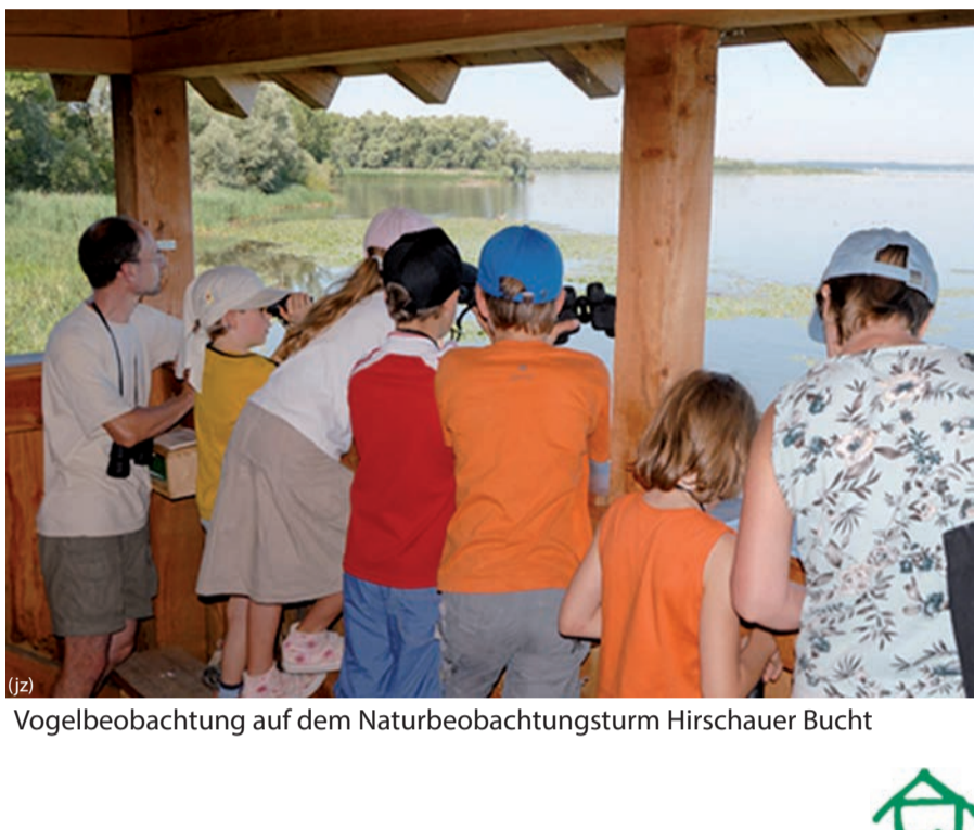
(jz) Vogelbeobachtung auf dem Naturbeobachtungsturm Hirschauer Bucht