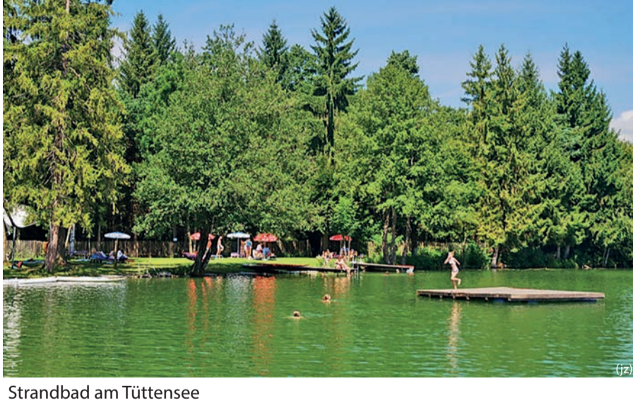
Strandbad am Tüttensee