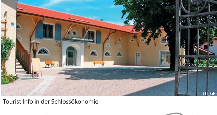
(TI_GR) Tourist Info in der Schlossökonomie