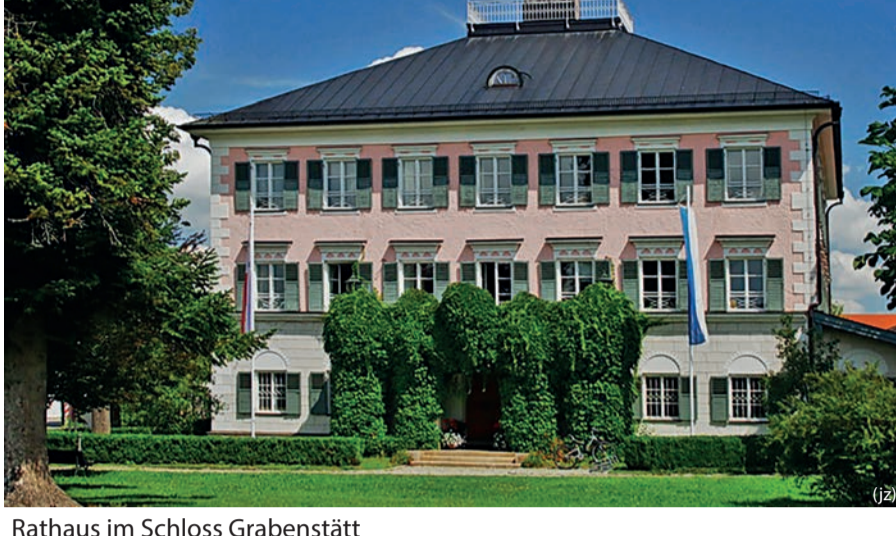
Rathaus im Schloss Grabenstätt

Einzelne Abschnitte am Chiemsee Rund- und Chiemsee Radweg sind als Erholungspromenaden vornehmlich für Fußgänger ausgewiesen.