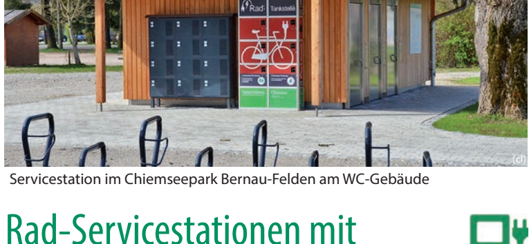
Servicestation im Chiemseepark Bernau-Felden am WC-Gebäude

Der Chiemsee Radweg steht allen Radfahrern, auch sportlichen Radlern und e-Bikern zur Verfügung und weist wunderbare Panoramaabschnitte auf. Länge: 59 km