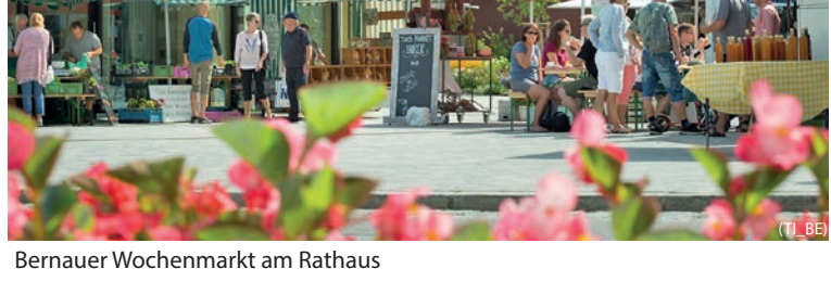
Bernauer Wochenmarkt am Rathaus