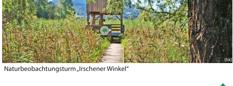
Naturbeobachtungsturm „Irschener Winkel“