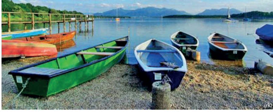
Blick über die Kailbacher Bucht auf die Bergkette