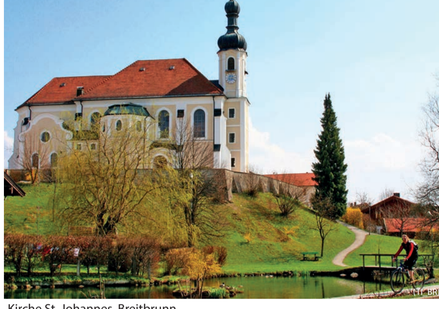
Kirche St. Johannes, Breitbrunn

Einzelne Abschnitte am Chiemsee Rund- und Chiemsee Radweg sind als Erholungspromenaden vornehmlich für Fußgänger ausgewiesen.