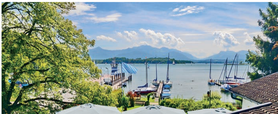
Blick von Mühlner auf die Herreninsel, die Kampenwand und in das Priental