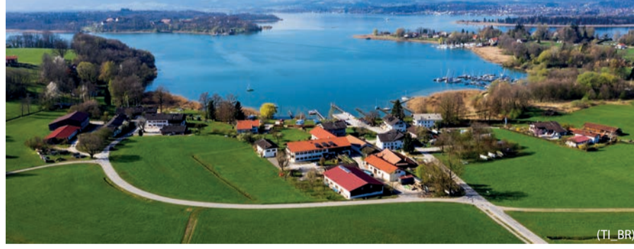
Mühlner Bucht im Frühjahr