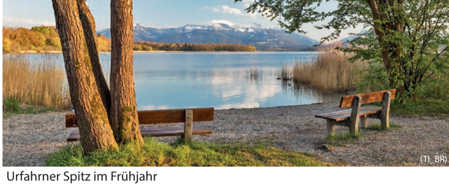
Urfahrner Spitz im Frühjahr